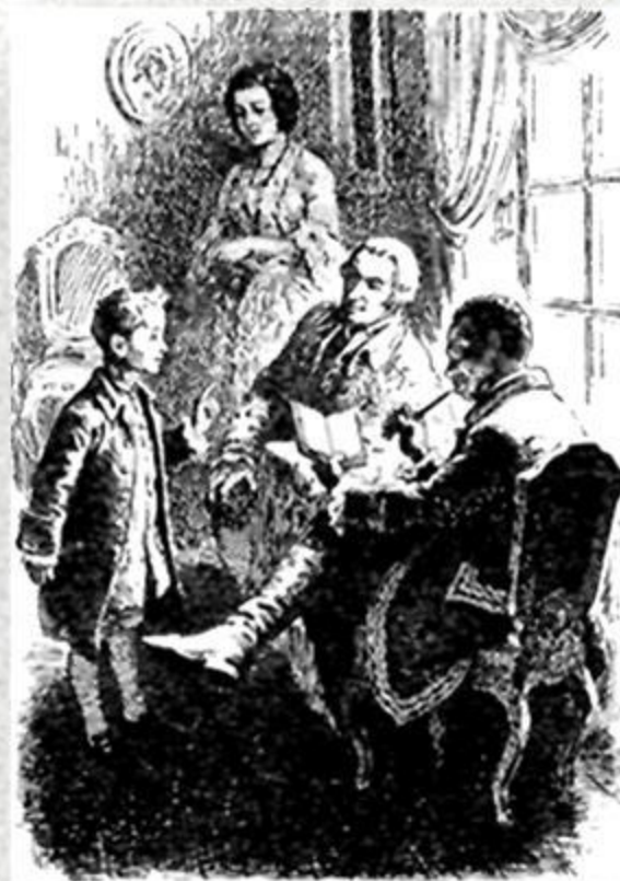
Александр Суворов и его отец Василий Суворов