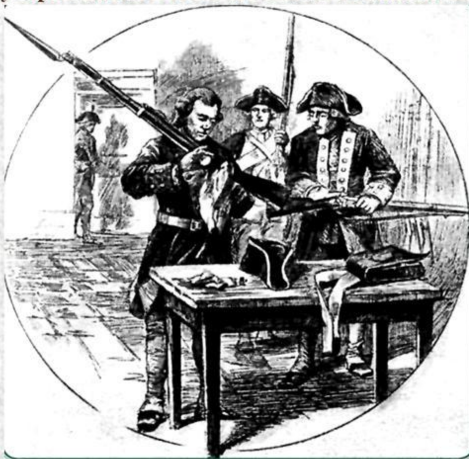
Н. Самокиш. Суворов-капрал Семеновского полка за чисткой оружия. 1748-1749 годы. 1899 г.

В 1742 году, по обычаю того времени, Суворова записали в лейб-гвардии Семёновский полк рядовым, а в семнадцать лет он начал действительную службу в чине капрала. С этого момента вся его жизнь была подчинена военной службе. Позднее Суворов писал о себе: «Я только военный человек и иных дарований чужд».