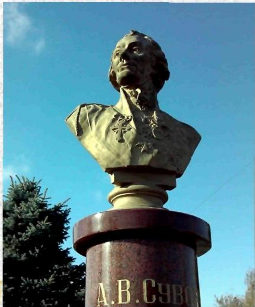
БЮСТ А. В. СУВОРОВА НАПРОТИВ ЗДАНИЯ АДМИНИСТРАЦИИ Г. УСТЬ-ЛАБИНСКА