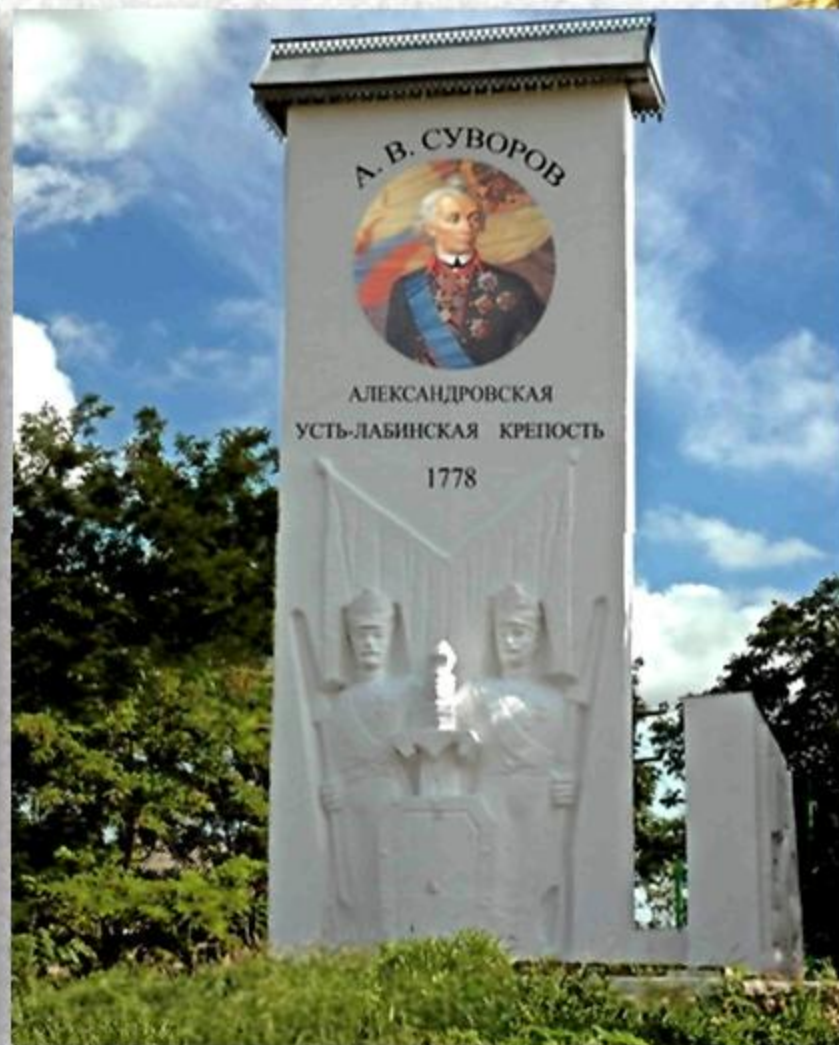
СТЕЛА СУВОРОВСКИМ СОЛДАТАМ ПО УЛ. ДЕМЬЯНА БЕДНОГО В Г. УСТЬ-ЛАБИНСКЕ