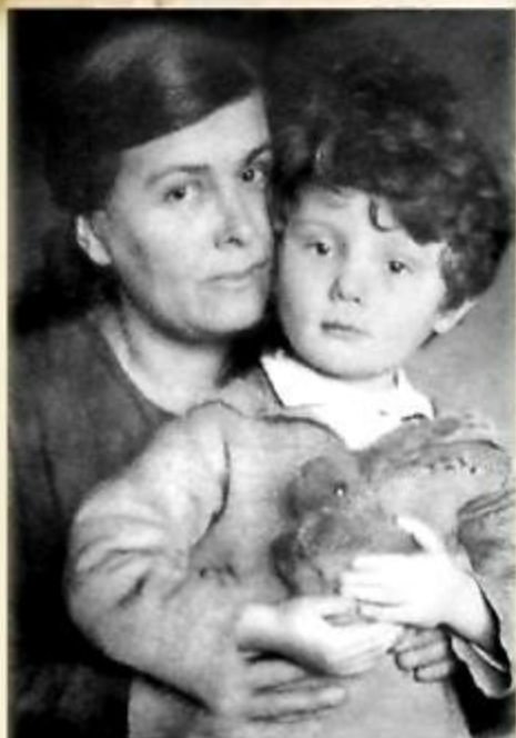
В детстве с матерью